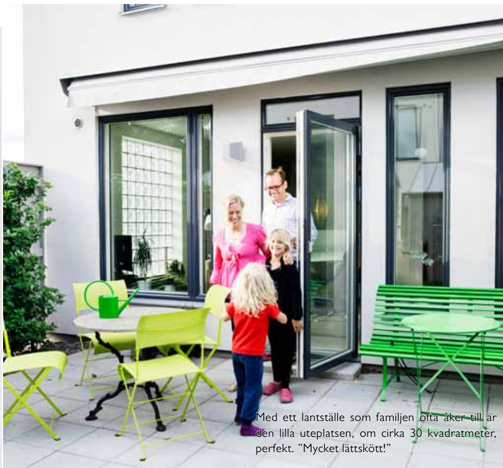
Med ett lantställe som familjen ofta åker till är den lilla uteplatsen, om cirka 30 kvadratmeter, perfekt. "Mycket lättskött!"