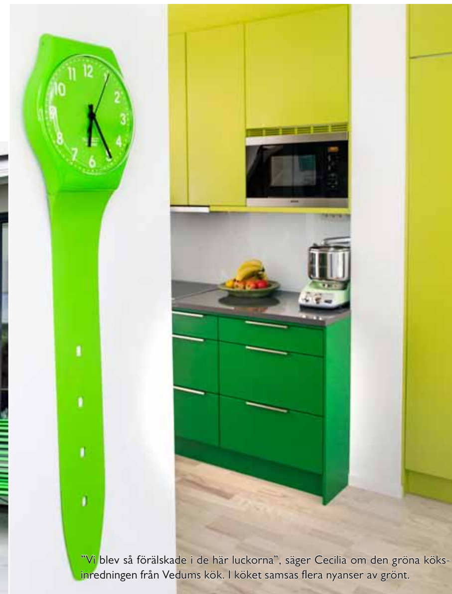
"Vi blev så förälskade i de här luckorna", säger Cecilia om den gröna köksinredningen från Vedums kök. I köket samsas flera nyanser av grönt.