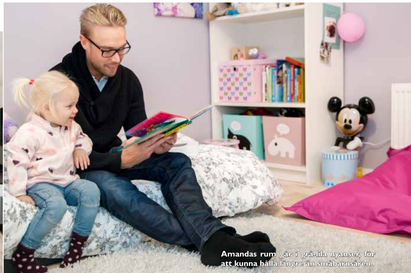
Amandas rum går i grå-lila nyanser, för att kunna hålla längre än småbarnsåren.