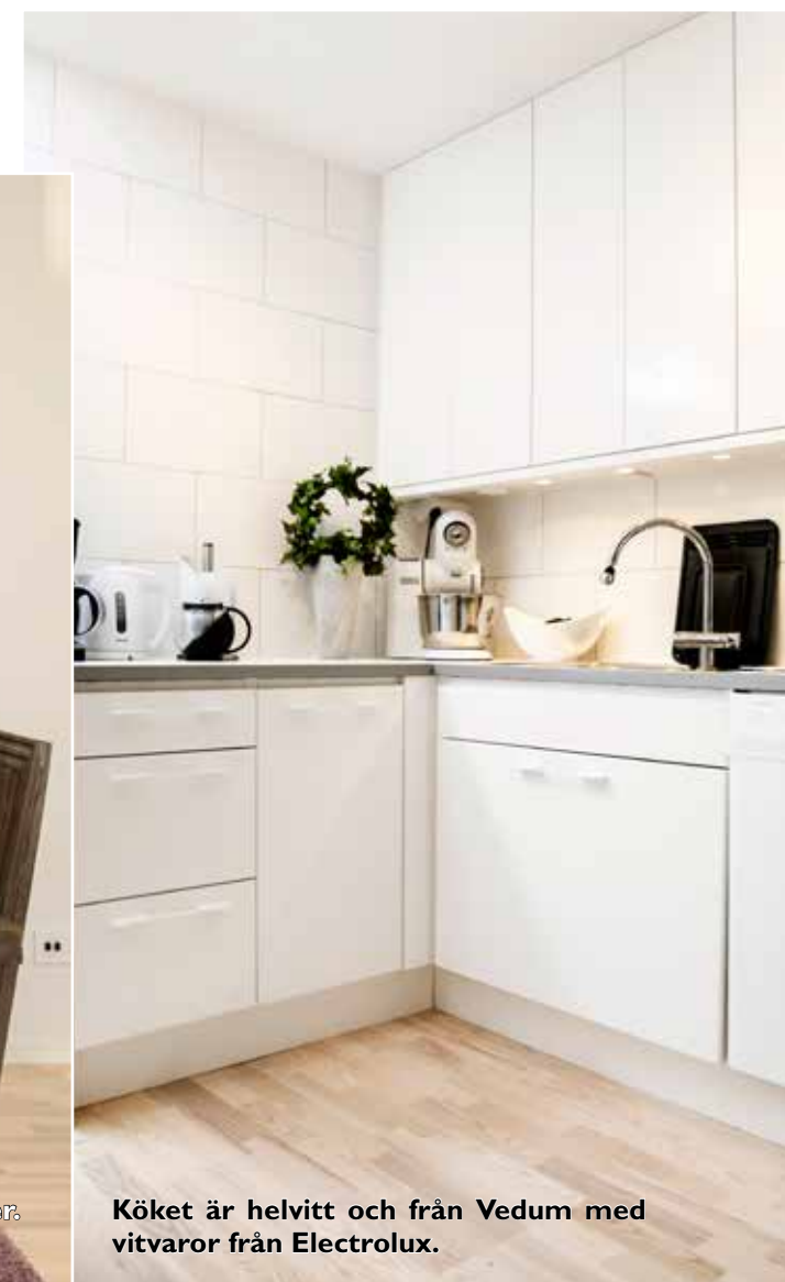
Köket är helvitt och från Vedum med vitvaror från Electrolux.