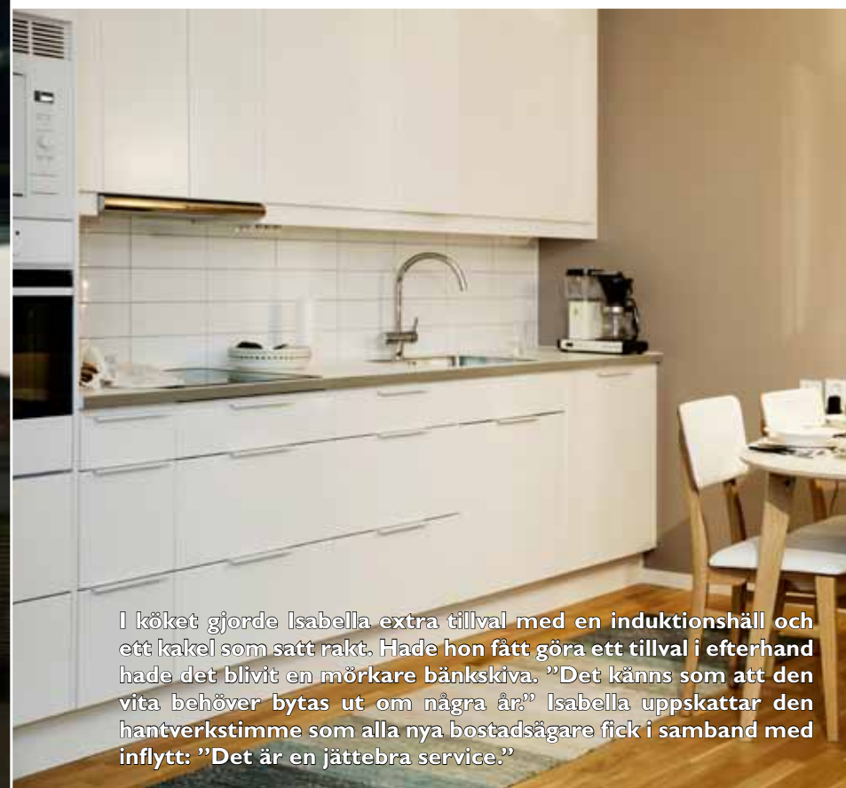
I köket gjorde Isabella extra tillval med en induktionshäll och ett kakel som satt rakt. Hade hon fått göra ett tillval i efterhand hade det blivit en mörkare bänkskiva. "Det känns som att den vita behöver bytas ut om några år." Isabella uppskattar den hantverkstimme som alla nya bostadsägare fick i samband med inflytt: "Det är en jättebra service."