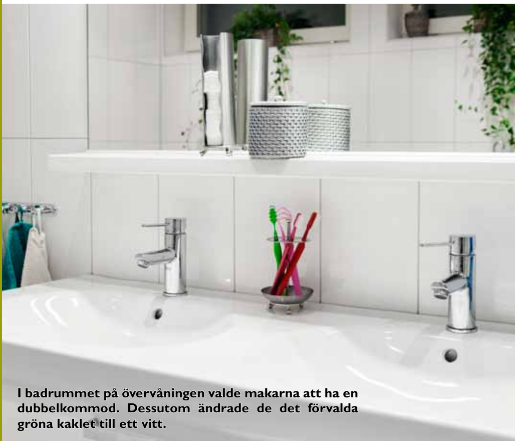
I badrummet på övervåningen valde makarna att ha en dubbelkommod. Dessutom ändrade de det förvalda gröna kaklet till ett vitt.

Som tävlingscyklist är det viktigt med närhet till naturen – och att ha plats för alla hojar såklart. De har själva isolerat förrådet och byggt en ramp för att lätt kunna ta in och ut cyklarna.