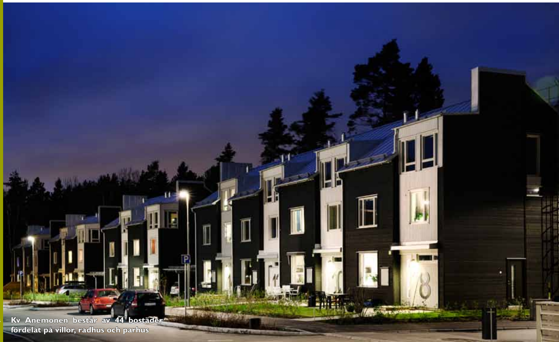
14 Kv Anemonen består av 44 bostäder fördelat på villor, radhus och parhus

Andra plus är närheten till så mycket – det tar en kvart in till centrala Stockholm och runt hörnet ligger förskolor, hunddagis, affärer, kafé, sjöar och naturområden.