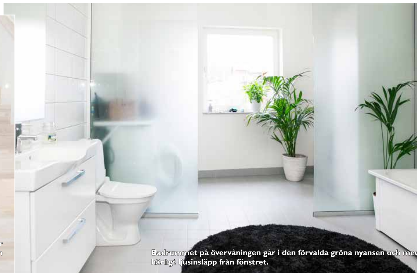
Badrummet på övervåningen går i den förvalda gröna nyansen och med härligt ljusinsläpp från fönstret.