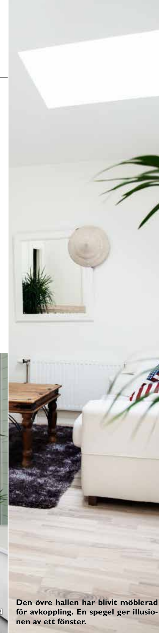
Den övre hallen har blivit möblerad för avkoppling. En spegel ger illusionen av ett fönster.