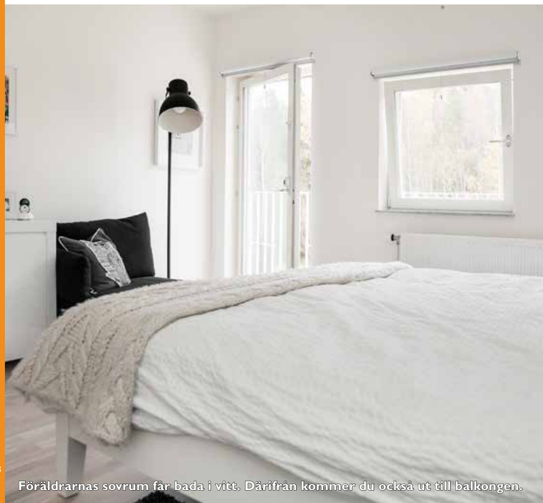
Föräldrarnas sovrum får bada i vitt. Därifrån kommer du också ut till balkongen.