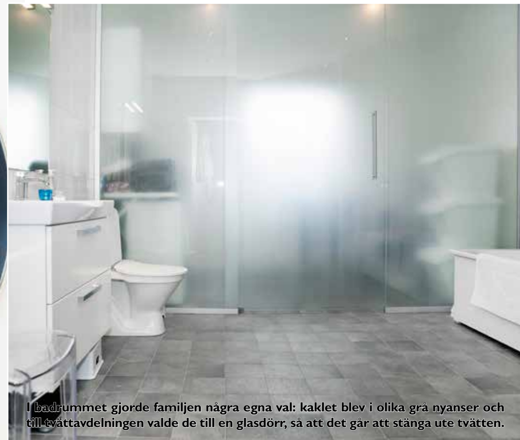
I badrummet gjorde familjen några egna val: kaklet blev i olika grå nyanser och till tvättavdelningen valde de till en glasdörr, så att det går att stänga ute tvätten.