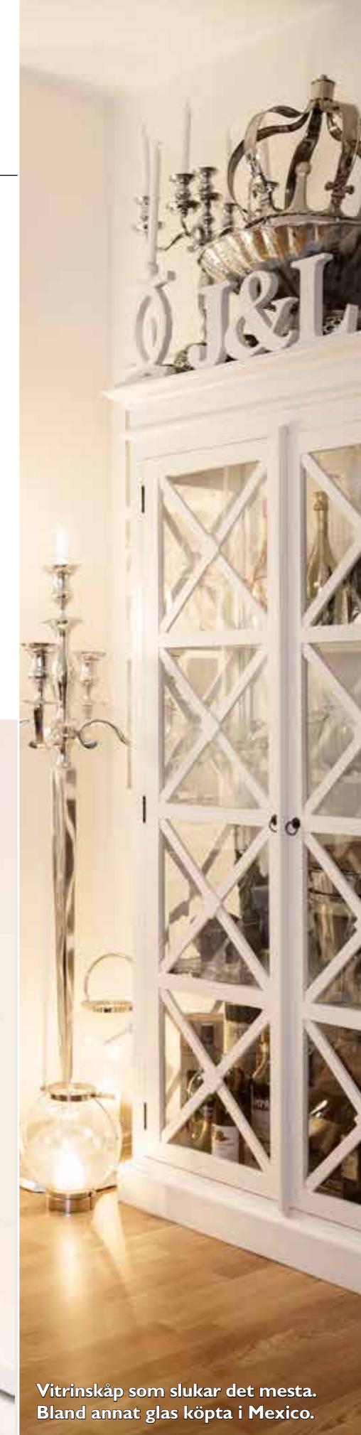
Vitrinskåp som slukar det mesta. Bland annat glas köpta i Mexico.